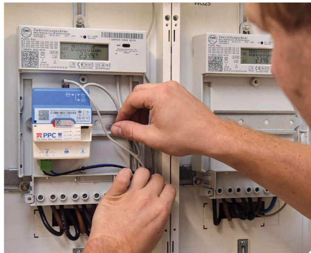
Bis 2032 werden schrittweise alle Zähler umgerüstet.