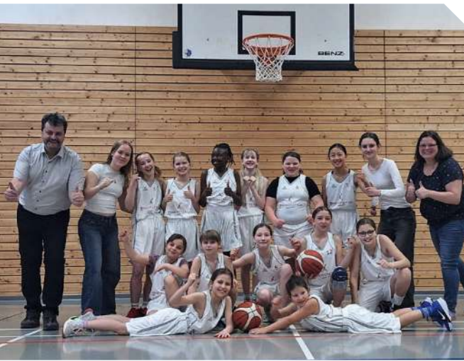
Die HEIMSTÄTTEN unterstützen als Sponsor den LadyBaskets Jena e.V., der mit viel Engagement, Teamgeist und Freude am Sport Mädchen und Frauen für den Basketball begeistert.