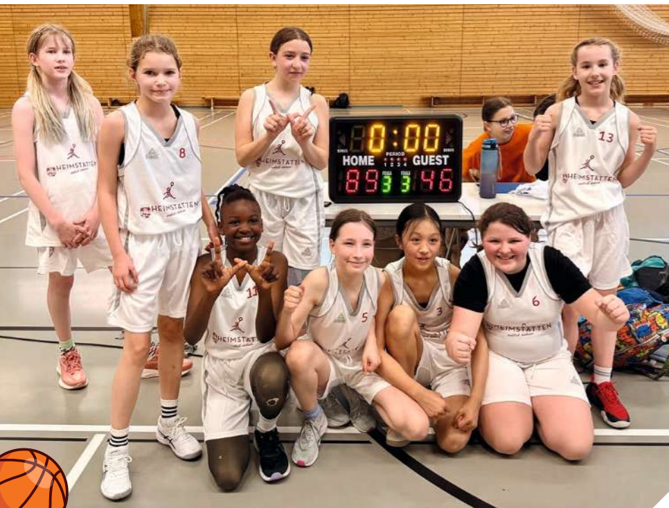
Erstes Spiel. Erster Sieg in den neuen Trikots